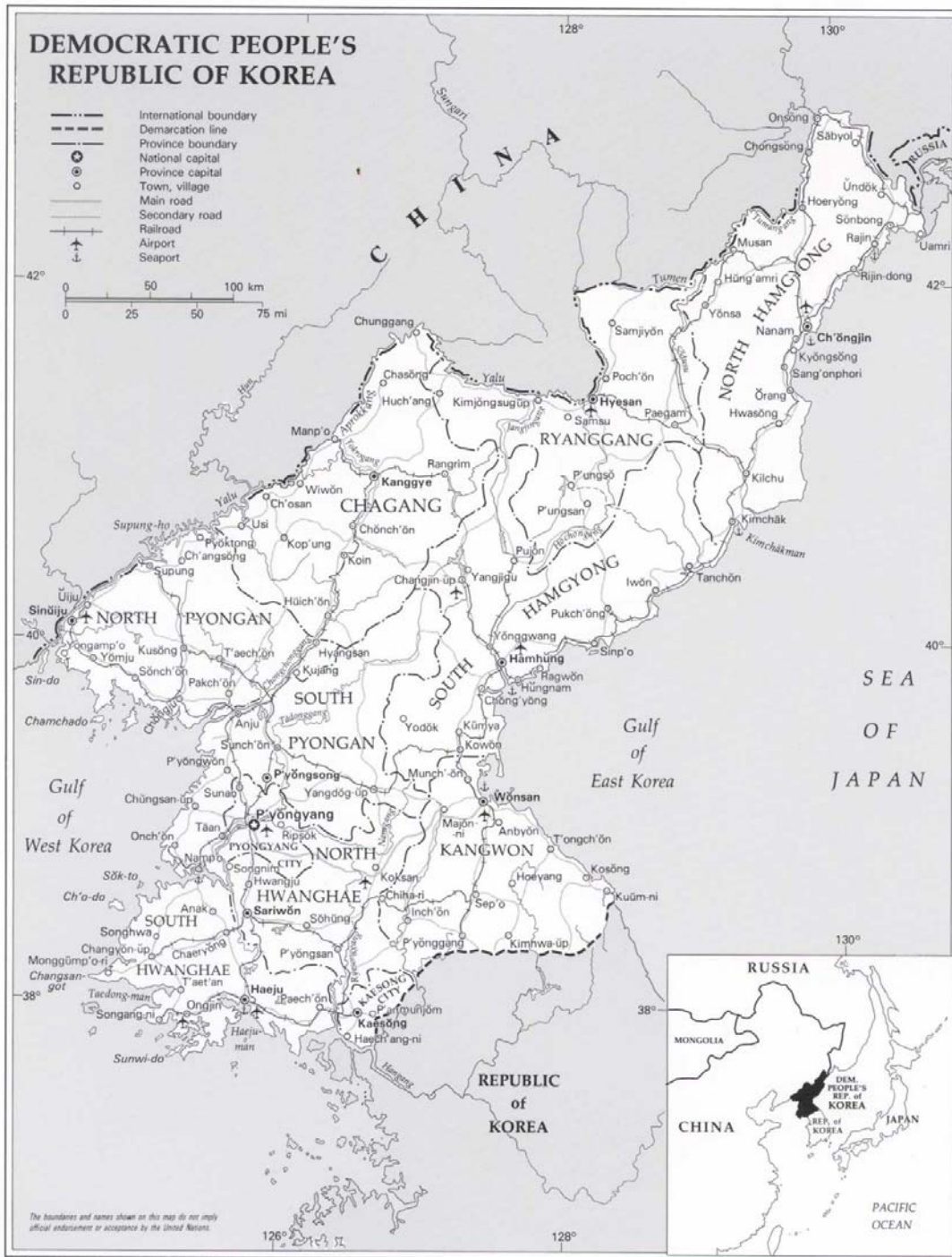
Abbildung 1: Democratic People's Republic of Korea 11